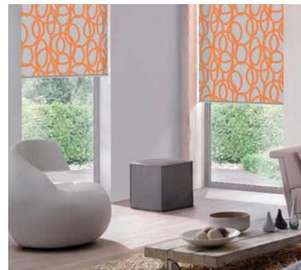
VNITŘNÍ LÁTKOVÉ STÍNĚNÍ