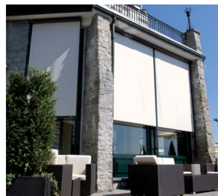
SVISLÉ FASÁDNÍ CLONY