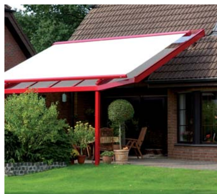
PERGOLY A ZIMNÍ ZAHRADY