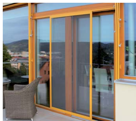
SÍŤ PROTI HMYZU